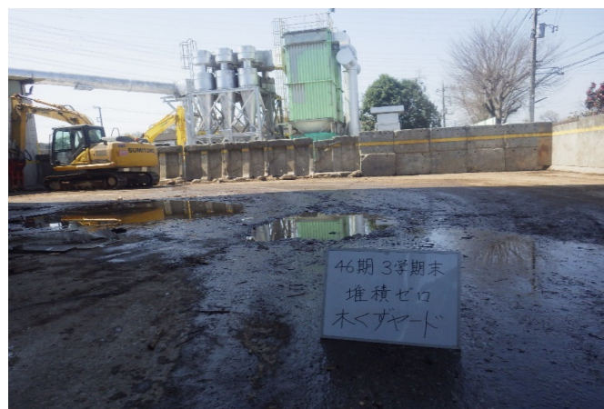
【5 木くず 保管ヤード】