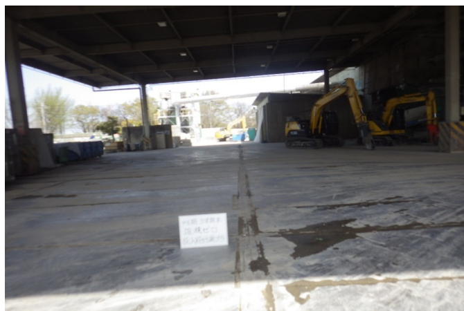
【2 廃プラスチック 選別ヤード】