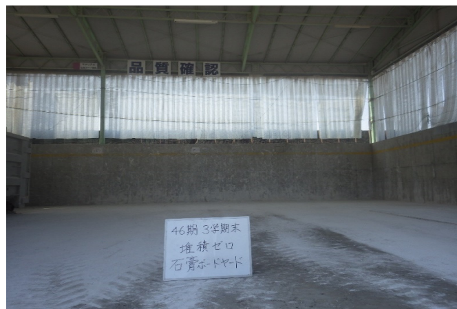
【3 石膏ボード 保管ヤード】