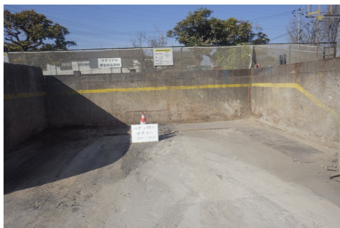
【4 がれき類 保管ヤード】