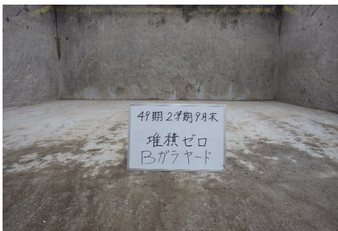
【4 がれき類 保管ヤード】