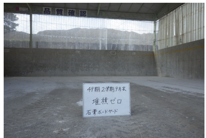
【3 石膏ボード 保管ヤード】