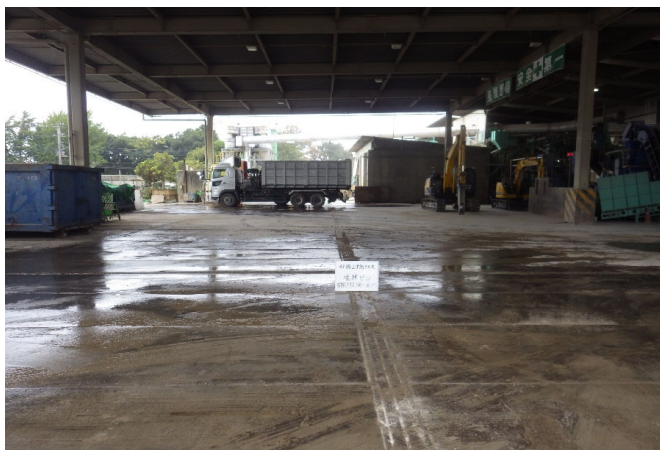
【2 廃プラスチック 選別ヤード】