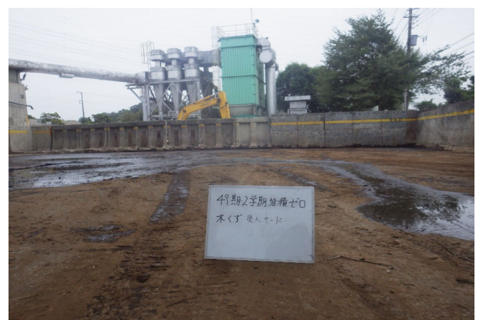
【5 木くず 保管ヤード】