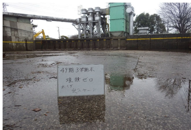
【5 木くず 保管ヤード】