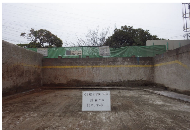
【4 がれき類 保管ヤード】