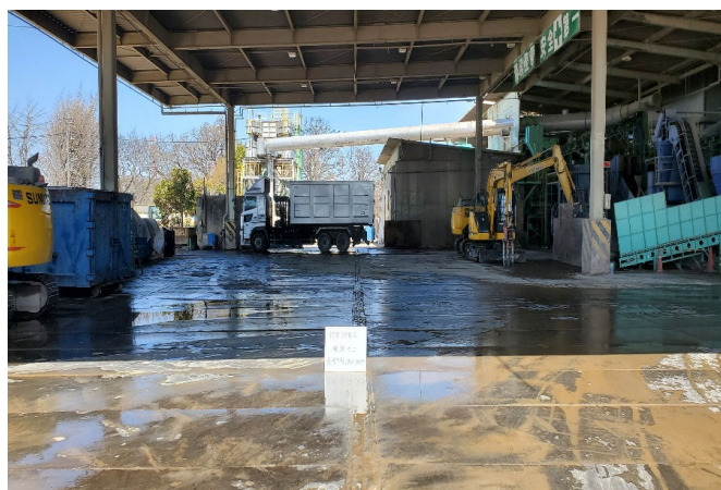
【2 廃プラスチック 選別ヤード】