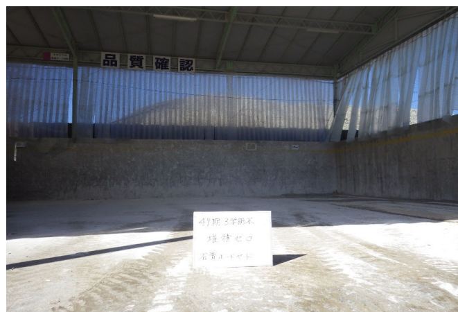
【3 石膏ボード 保管ヤード】