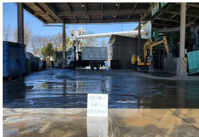
【1 混合廃棄物 選別ヤード】