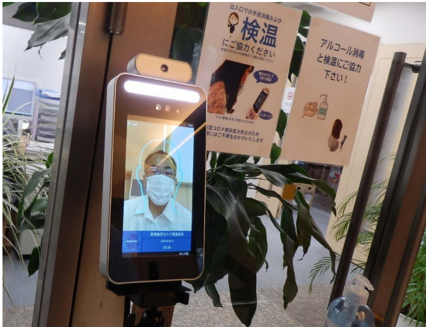
《 本 社 》